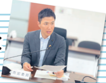
商工労働常任委員会で質疑

東京湾アクアラインの渋滞緩和に向け、千葉県では7月22日から、時間帯によって料金を変える「ロードプライシング」を導入することになりました。また同日、千葉県の高速道路が定額で乗り降り自由となるドラ割『千葉ぐるっとパス』が発売されます。これを契機に市町村との連携を図り、県内での滞在時間の延長や消費拡大へとつなげていけるよう要望しました。