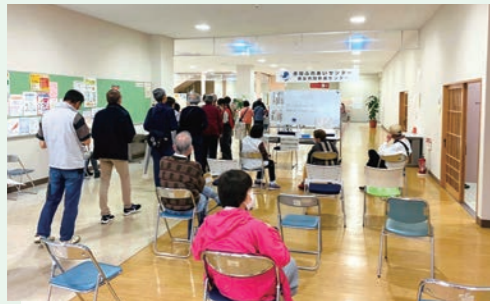
赤坂ふれあいセンター

集団接種の常設会場は「赤坂ふれあいセンター」と地区会場として市内10か所を巡回して接種が行われていますが、6/29からは「イオンモール成田」を常設会場とし、7月中旬には「ボンベルタ成田」を加え、2か所で実施予定です。