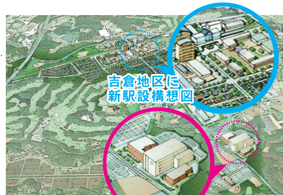
吉倉地区に新駅設構想図

構想駅は、京成本線の成田駅と空港第2ビル駅のほぼ中間地点にあたる吉倉地区に位置付けられています。成田空港の機能強化により1万人が、そして医療関連産業の集積などにより2千人の人口増加が見込まれます。今後は関係機関・権利者との調整や合意形成など、実現可能性を模索することになります。