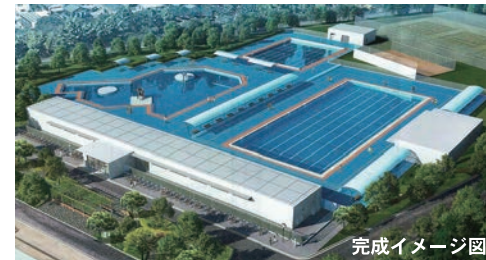
図は中台運動公園水泳プールの完成予想図です。めめっとしていた更衣室は新設され、新しいプールは深さを任意に変えることができる「可動床」が取り入れられるなどプールが刷新されます。